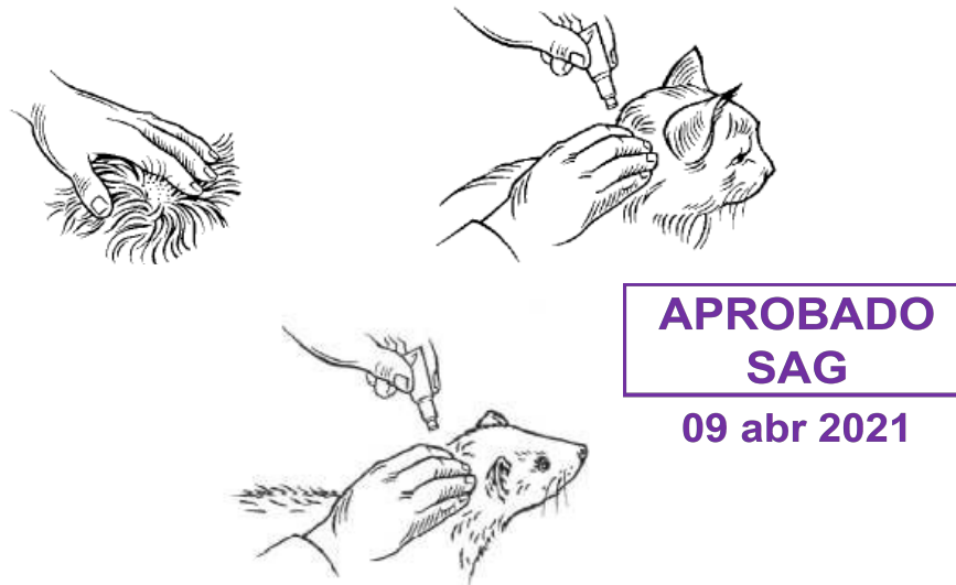
Figura N° 2.

Separe el pelo del cuello del animal en la base del cráneo hasta que la piel sea visible. Coloque la punta de la pipeta sobre la piel y apretar la pipeta con firmeza para vaciar su contenido directamente sobre la piel (Figura N° 2). La aplicación en la base del cráneo reducirá al mínimo la oportunidad de que el animal se lama el producto. Aplicar sólo en piel en buen estado.